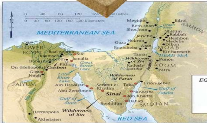
EGYPT: LAND OF BONDAGE ● City ○ City (uncertain location) ● City (modern name) ◊ Cataract